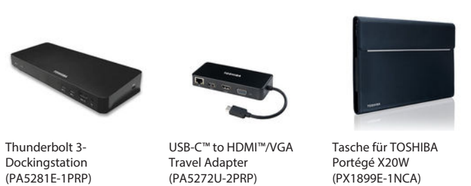
Thunderbolt 3-Dockingstation (PA5281E-1PRP)